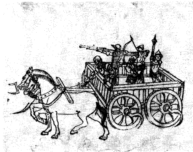
Roberto Valturio: De re militari. Verona: Johannes Nicolai 1472. Einer von 100 Holzschnitten aus dem Werk über die Kriegskunst. Provenienz: Carl August von Sachsen-Weimar