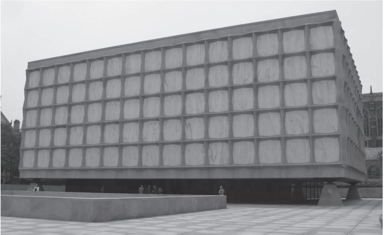
Abb. 5: Beinecke Library, Yale/New Haven

samten Bestandes stabilisierte: Sie brachte ungebundenes Material in neuen säurefreien Schachteln unter, führte Buchhüllen für besonders wertvolle oder gefährdete Einbände ein, traf Entscheidungen über Buchreparaturen und neue Einbände, außerdem begutachtet sie das Material für die Digitalisierung. Besonders große Materialien werden auf geeignete Regale gelegt. Das Magazin machte einen vorbildlich gepflegten Eindruck.