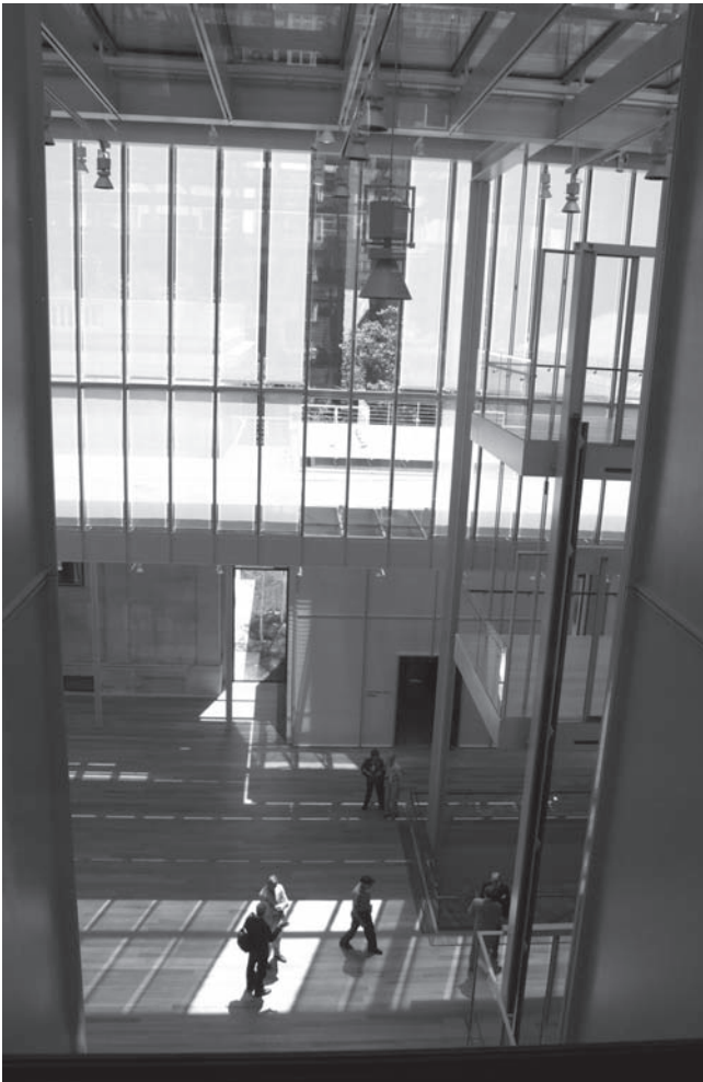
Abb. 3: Innenraum der neuen Pierpont Morgan Library and Museum, New York

Die Sammlung der Alten Drucke beherbergt eine exzellente Kollektion von 2 697 Inkunabeln, wertvollen illuminierten Titeln und historischen Kinderbüchern. Unter den 24 000 Zeichnungen und Stichen befindet sich die größte Sammlung an Rembrandt-Radierungen in den USA sowie Werke von allen großen Zeichnern dieser Welt. Ein eher ungewöhnliches Segment besteht in der weltweit größten Sammlung von Siegeln und kleinen Schrifttafeln aus dem Alten Orient. Hier spiegelt sich ein spezielles Interesse von Pierpont Morgan wider.