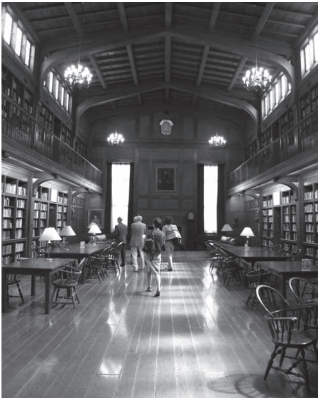
Abb. 4: Lesesaal der Medical Historical Library, Yale/New Haven

Der Erwerb weiterer Gelehrtenbibliotheken (beispielsweise die Clements C. Frye Print Collection mit Drucken und Zeichnungen zu medizinischen Themen vom 15. bis 21. Jahrhundert und die Peter Parker-Sammlung mit Manuskripten des medizinischen Missionars Peter Parker aus dem 19. Jahrhundert) sowie umfangreiche antiquarische Käufe haben die Medical Historical Library zu einer einzigartigen Sammlung seltener und kostbarer medizinischer Bücher, Zeitschriften, Flugblätter, Drucke, Fotografien sowie aktueller Literatur zur Geschichte der Medizin gemacht. Besondere Glanzlichter sind Werkausgaben von Hippokrates, Galen, Vesalius, Boyle, Harvey, S. Weir Mitchell; der Bestand ist besonders stark im Bereich Anästhesie und Pockenimpfung sowie Impfung generell.