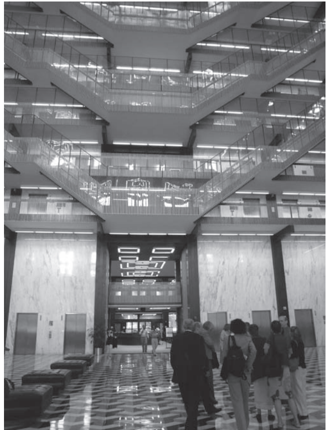
Abb. 1: Empfangshalle der Bobst Library, New York

Die Sondersammlungen der Bobst Library, die wir bei dieser Gelegenheit natürlich auch kennenlernen wollten, haben ihre Schwerpunkte in englischen Romanen seit der Mitte des 18. Jahrhunderts, in einer Sammlung von Kochbüchern aus eben demselben Zeitraum, in Sammlungen zur New Yorker Kunstszene, zum spanischen Bürgerkrieg und zur Geschichte der Linken und der Arbeiterbewegungen. Man setzt auf Medienvielfalt, sieht eine Zuständigkeit für New York, nicht unbedingt für das ganze Land. Die Bibliothek unterhält ein Programm für Fellows, deren Forschungsschwerpunkte der Kalte Krieg und seine Auswirkungen auf Amerika sind. Selbstverständlich ist hier, wie auch in den später besuchten Bibliotheken, die Teilnahme an den zentralen Katalogen RLIN (Research Libraries Information Network) und WorldCat. Daten werden in sogenannten Finding Aids, also Findbüchern, in XML-Struktur im EAD-Format erfasst, aus dem lokalen System über die EAD-Schnittstelle in die beiden Zentralnachweise eingespielt und sind damit sowohl lokal als auch in der Spezialumgebung der von RLG verwalteten RLIN als auch in dem zur Zeit 67 Mio. umfassenden, von OCLC betriebenen WorldCat nachgewiesen. Diese Praxis sollte uns während der ganzen Fahrt immer wieder begegnen.