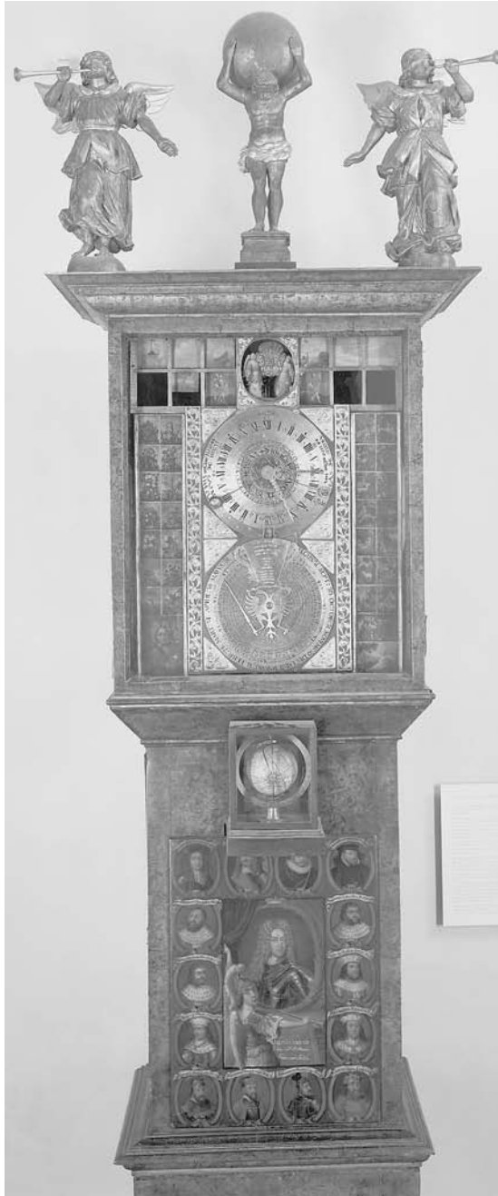
Abbildung 2 Johann Asmann, Lebensuhr des Herzogs Wilhelm Ernst von Weimar, Standuhr mit Glockenspielwerk, 1706