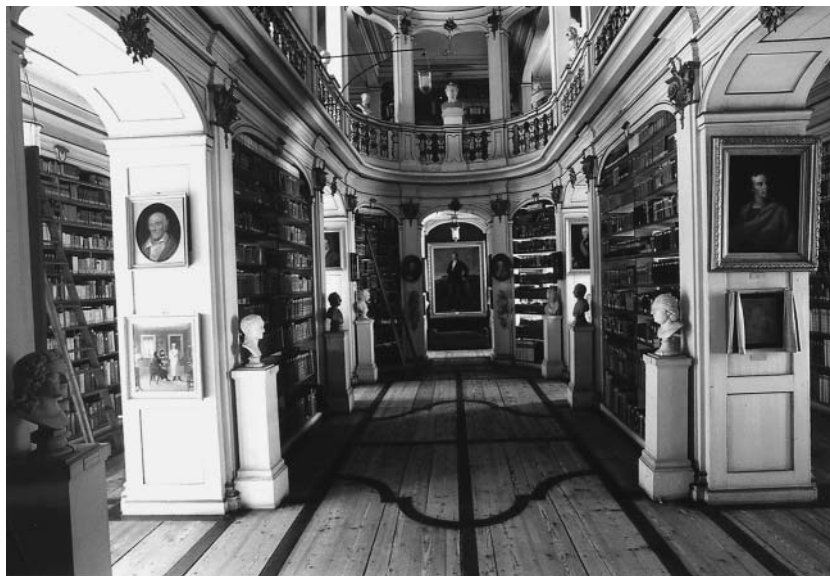
Der Rokokosaal vor dem Brand.

Die Quellenorientierung, die die Herzogin Anna Amalia Bibliothek als Forschungsbibliothek von den meisten anderen wissenschaftlichen Bibliotheken unterscheidet, hat zur Konsequenz: