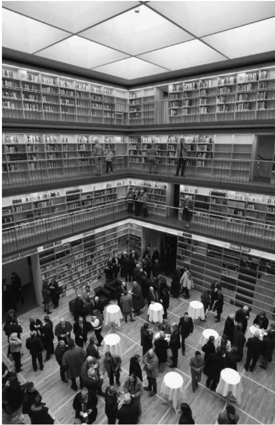
Blick in den Bücherkubus am Tag der Einweihung 4.2.2005.

erreichen. Dort befindet sich auch der separate Hauptlesesaal für den historischen Buchbestand zur beaufsichtigten Lektüre. Durch seine Raumhöhe und die Lage über der Eingangshalle mit Blickbeziehung zum Stammhaus liegt er an einem repräsentativen Ort im Ensemble. Der Lesesaal selbst beschränkt sich auf 32 vernetzte Arbeitsplätze. Dort sind keinerlei Bücher untergebracht. Nachschlagewerke oder Forschungsliteratur können aus dem angrenzenden Freihandbestand in den Lesesaal geholt werden. In der Nähe des Lesesaals sind sechs Carrels als Einzelleseplätze angeordnet.