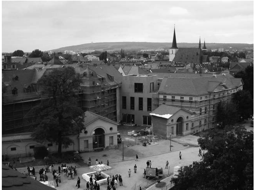
Blick auf das neue Studienzentrum. Links, eingerüstet, das Rote Schloss mit der Bibliotheksverwaltung. Im Zentrum das neue Eingangsgebäude. Hinter den hohen Fenstern liegt der Hauptlesesaal. In dem anderen eingerüsteten Gebäudekomplex, einer Dreiflügelanlage mit dem Gelben Schloss, sind vor allem die Freihandbereiche untergebracht. Der Bücherkubus, auf dem Bild nicht zu erkennen, befindet sich in der Mitte dieser Anlage. Unterhalb der Straße liegt der Lesebereich Park. Nicht sichtbar ist das Tiefmagazin (links, unter dem Platz der Demokratie).

Im Herbst 1999, ein paar Wochen nach dem 250. Geburtstag Goethes, wurde für das Bauvorhaben ein europaweiter Wettbewerb ausgeschrieben. 280 Bewerbungen von Architekturbüros wurden eingereicht, über die am 28. April 2000 ein prominent zusammengesetztes unabhängiges Preisgericht unter Vorsitz von Karljosef Schattner zu entscheiden hatte. 5 Den ersten Preis vergab die Jury einstimmig an die Architektengemeinschaft Barz-Malfatti, Rittmannsperger, Schmitz (Weimar/ Erfurt). Ihr Entwurf, der sich – wie es in der Begründung heißt – durch einen sensiblen Umgang mit der historischen Bausubstanz und hohe Funktionalität auszeichne, setze mit einem neuen Mittelbau im Schloßerkomplex sowie unterschiedlichsten Blickbeziehungen behutsam neue Akzente. Das Tiefmagazin, das die alte Bibliothek mit ihren neuen Funktionsbereichen unterirdisch verbindet, öffne sich mit einem Freihandmagazin und weiteren Leseplätzen hinter einer Fensterfassade zum Park an der Ilm. Die Preisträger wurden auch mit der Ausführungsplanung beauftragt.